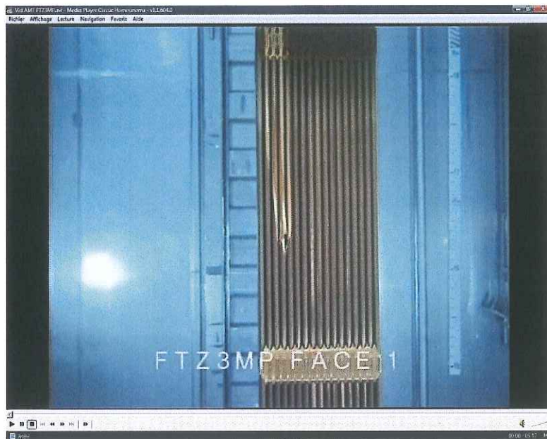
3) Assemblage FTZ3MP (partie supérieure)