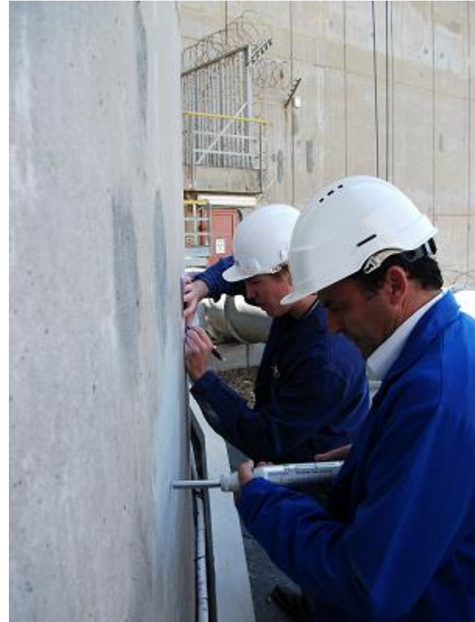
Auscultation au Scléromètre pour circonscrire le béton atypique

Dans le cadre des travaux de maintenance des parements externes des Bâtiments réacteur, un défaut de parement de l'enceinte de Gravelines 2 a été découvert : un béton atypique sur 20 ml, 50 cm de hauteur et 80 cm de profondeur.